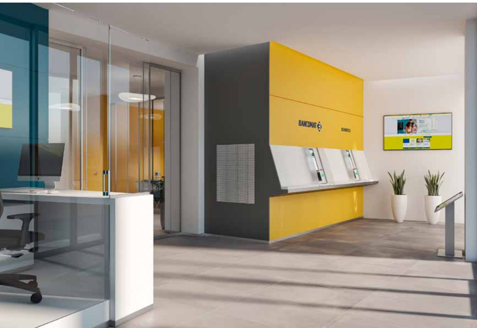
Il rendering della nuova area self della filiale di Largo Nazario Sauro a Trento.

ta del cantiere le mansioni di cassa e consulenza saranno provvisoriamente dislocate nella ex Filiale di Via Brennero 94, negli uffici nei quali durante la scorsa estate si è somministrato il servizio di Dichiarazione dei Redditi per i Soci e i loro congiunti.