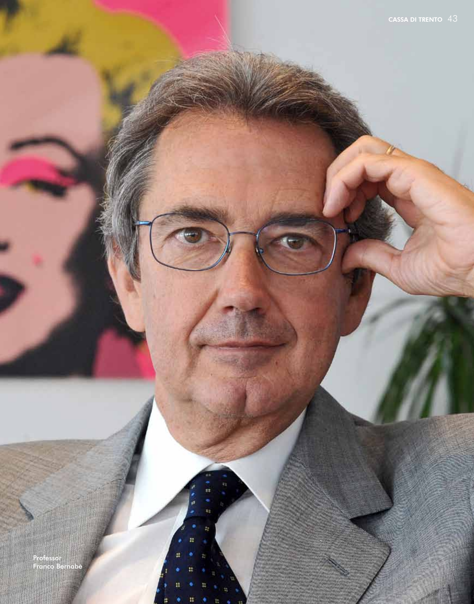
Professor Franco Bernabè