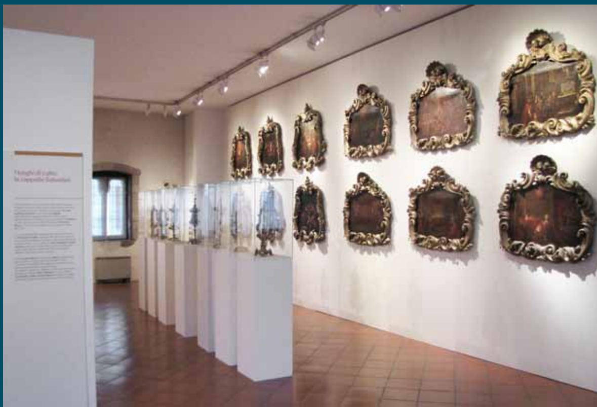
Il percorso sul Simonino al Museo Diocesano

successo senza precedenti nella storia delle mostre allestite presso il Museo Diocesano. Durante il lockdown sono state organizzate iniziative online. La mostra è stata poi riaperta il 2 giugno, con tutte le precauzioni necessarie ed ha chiuso i battenti il 15 settembre.