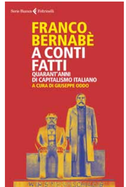
L'ultimo libro di Franco Bernabè

La sua esperienza manageriale l'ha vista condurre, fra le altre cose, il processo di dismissione delle partecipazioni statali di due giganti economici strategici italiani, ENI e TELECOM ITALIA. Nel libro descrive con dovizia di particolari tali complesse operazioni, evidenziando il successo della prima iniziativa in termini organizzativi, di rivalutazione economica e di presenza strategica per lo Stato e l'insuccesso della seconda in termini di insta-