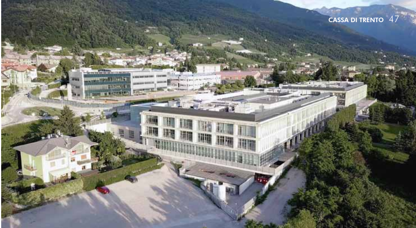
Un esempio di investimento pubblico in ricerca e formazione: FBK e Dipartimento di Fisica a Povo di Trento

Nelle difficoltà del presente e in considerazione dei cospicui finanziamenti per l'istruzione, la digitalizzazione, il lavoro, la sanità e la decarbonizzazione che l'Unione Europea rende disponibili con il progetto di aiuti denominato "Recovery Fund", quali sono le emergenze alle quali il sistema Italia deve primariamente metter mano, con piani sostenibili di lungo periodo, per costruire, soprattutto, l'avvenire dei più giovani?