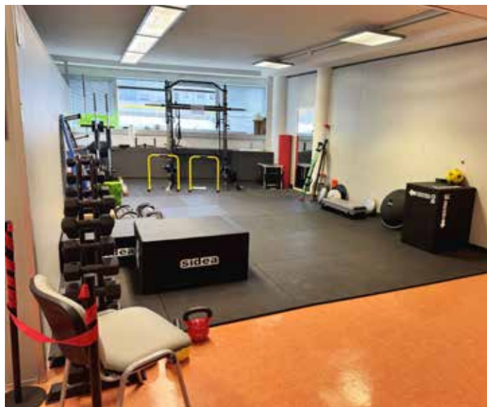
Una nuova sala Fisioterapia