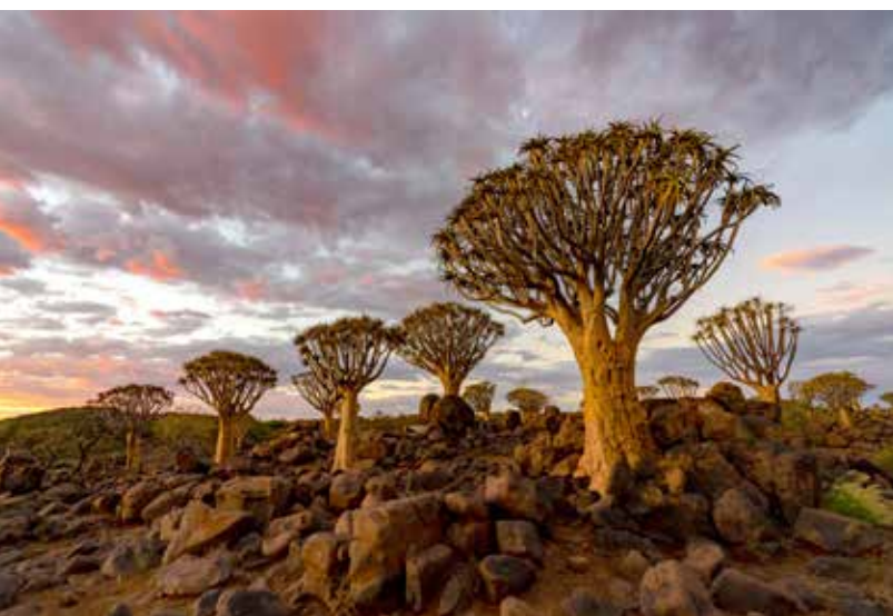
L'affascinante paesaggio della Namibia

Le destinazioni definitive verranno svelate nelle prossime settimane, ma una cosa è certa: anche nel 2026 viaggeremo insieme, con lo spirito di chi sa che ogni partenza è un'occasione per imparare qualcosa di nuovo — su di sé, sul mondo e sulle persone che ci accompagnano nel cammino.