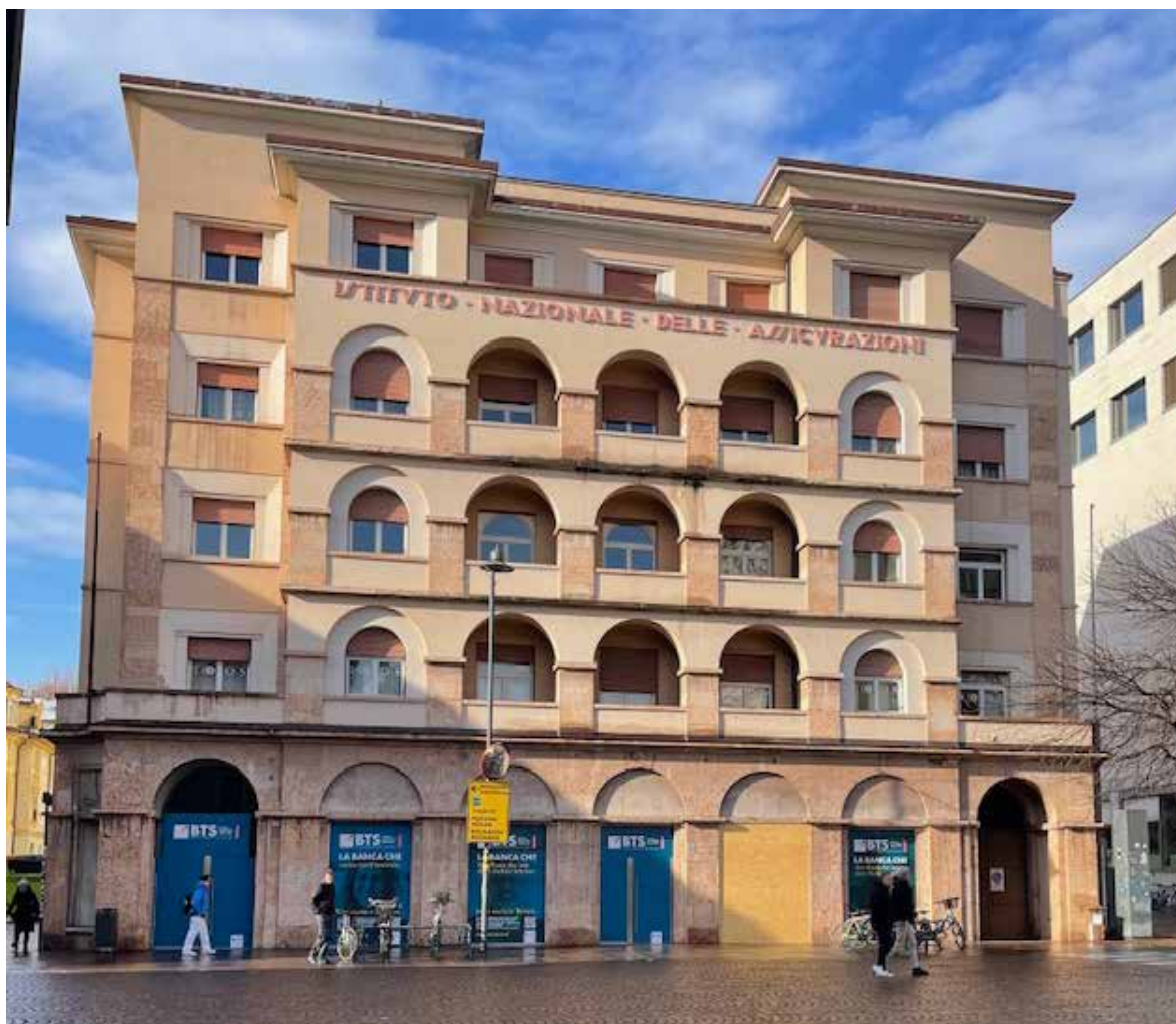
La nuova filiale di Bolzano in Piazza Domenicani 28 (prossima apertura)

tela, Soci e Soggetti economici. Viviamo l’era del “digitale”, e noi vogliamo declinare questa opportunità quale fattore abilitante le relazioni umane: siamo convinti che la strada sia questa, persone “al centro” che valorizzano e rinsaldano i rapporti anche attraverso strumenti, soluzioni e canali innovativi. Così vediamo e vogliamo il nostro futuro. Peraltro, un riscontro immediato e concreto è rappresentato dalla volontà di proporre il nostro modo di fare impresa in altri territori: tra poche settimane sarà inaugurata la filiale di Bolzano, vogliamo esprimere con determinazione i nostri valori anche in Alto Adige.