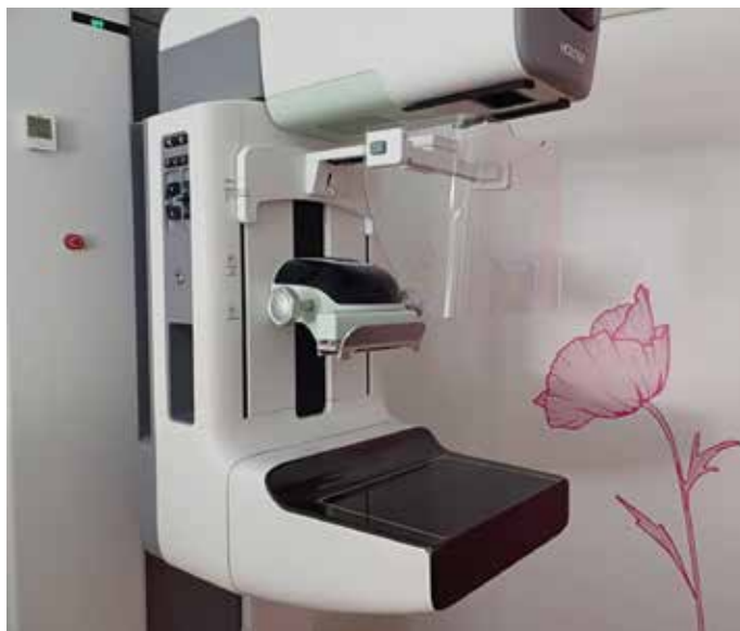
Il nuovo mammografo per l'Unità operativa di senologia clinica di Trento