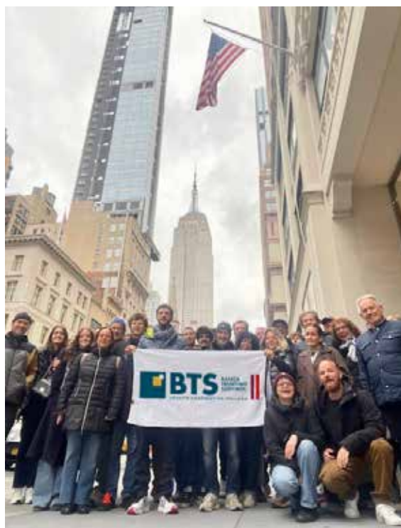
Il gruppo maratona New York

Tra le prime anticipazioni, siamo felici di segnalare un'esperienza unica: il viaggio in Namibia , dal 1° al 15 aprile, alla scoperta di paesaggi