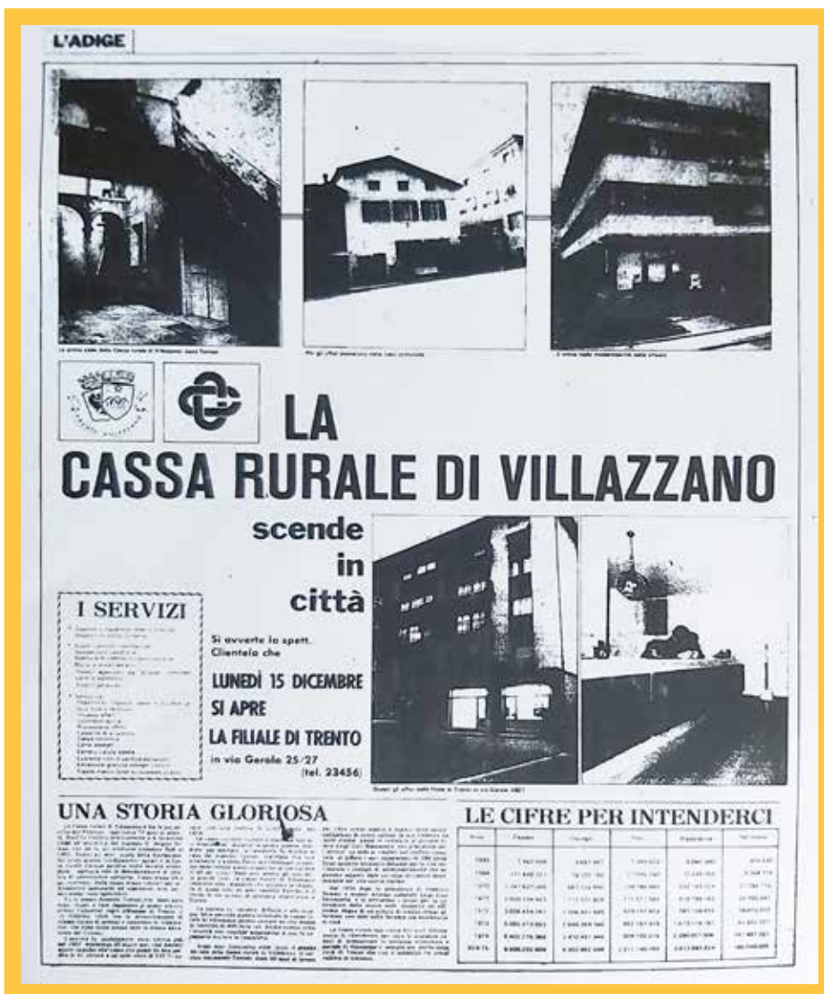
Pagina del Quotidiano "L'Adige"

tri ci sono due bar, una fioreria, il tabaccaio-edicola, il barbiere, una piccola pompa di benzina, la pasticceria Filippi & Gardumi. Ovvio, c'è una farmacia proprio di fronte all'entrata dell'ospedale e attigua al supermercato.