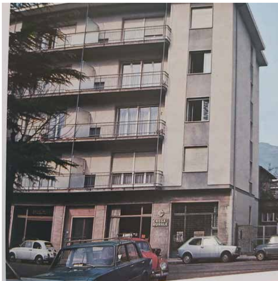
La filiale di via Gerola