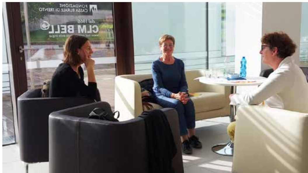
L'aula lingue di Clm Bell a Mezzocorona

Per esercitare l'inglese in un contesto informale, migliorare la sicurezza nel parlare partecipando a un ricco programma di eventi social guidati da insegnanti di inglese, Clm Bell propone "Clm Bell Social Club" . Il programma include giochi da tavolo, serate di conversazione, club del libro, sessioni di canto e molto altro. Gli incontri si svolgono da ottobre a dicembre tutti i giovedì dalle 18.30 alle 20 presso Clm Bell.